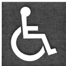
สัญลักษณ์ผู้พิการ